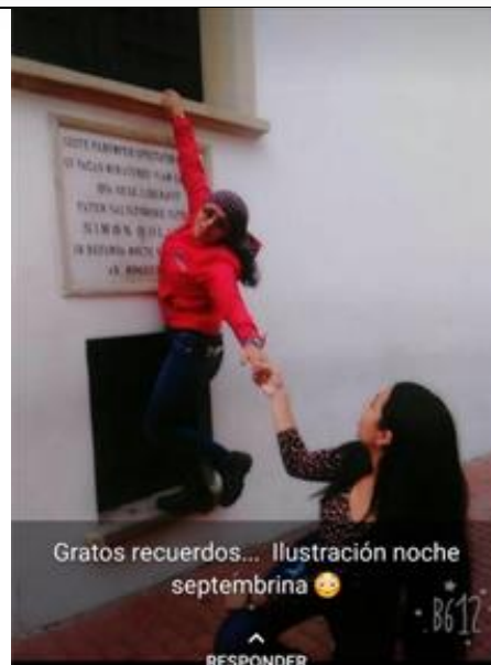
Gratos recuerdos... Ilustración noche septembrina 🌟

Realice una línea tiempo de los objetos más antiguos que encuentre en su casa, pregúnteles a sus padres y/o cuidadores la historia de ellos, usos y anécdotas frente a estos elementos, tome una fotografía y cuéntenos como ha sido la evolución de este a través del tiempo, indique su favorito y mencione que le agregaría para que sea aún más innovador de lo que ya es para estos tiempos.