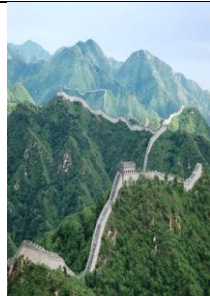
La Gran Muralla China

Colección única y antigua (800 AC) de edificios tallados sobre la piedra del mismo lugar por lo que es llamada: La ciudad Rosa . Es impresionante ver, como esta construcción en pleno desierto, contaba con abastecimiento de agua. Como se construyó sobre un cañón montañoso en piedra con senderos sinuosos, ofrecía seguridad para los habitantes de la época evitando ataques de otros pueblos. Pertenece al turismo arqueológico.