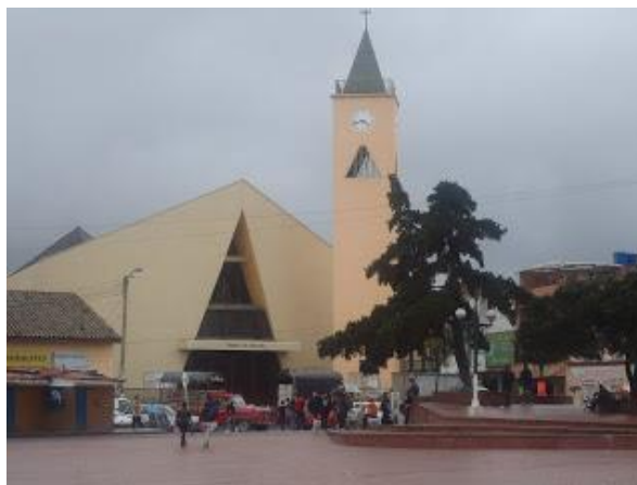
Imagen tomada de:

estructural se mantienen en pie. Está incluida en el territorio de la Diócesis de Soacha, tiene un valor cultural para los Soachunos que junto con la plaza, es motivo de orgullo por el ancestro patrimonial de la misma.