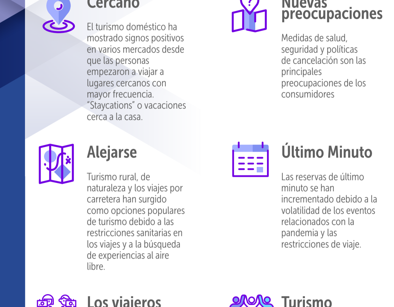
Fuente: "2020: The year travel paused, Google. Corte a 4 de febrero de 2021 (IATA).